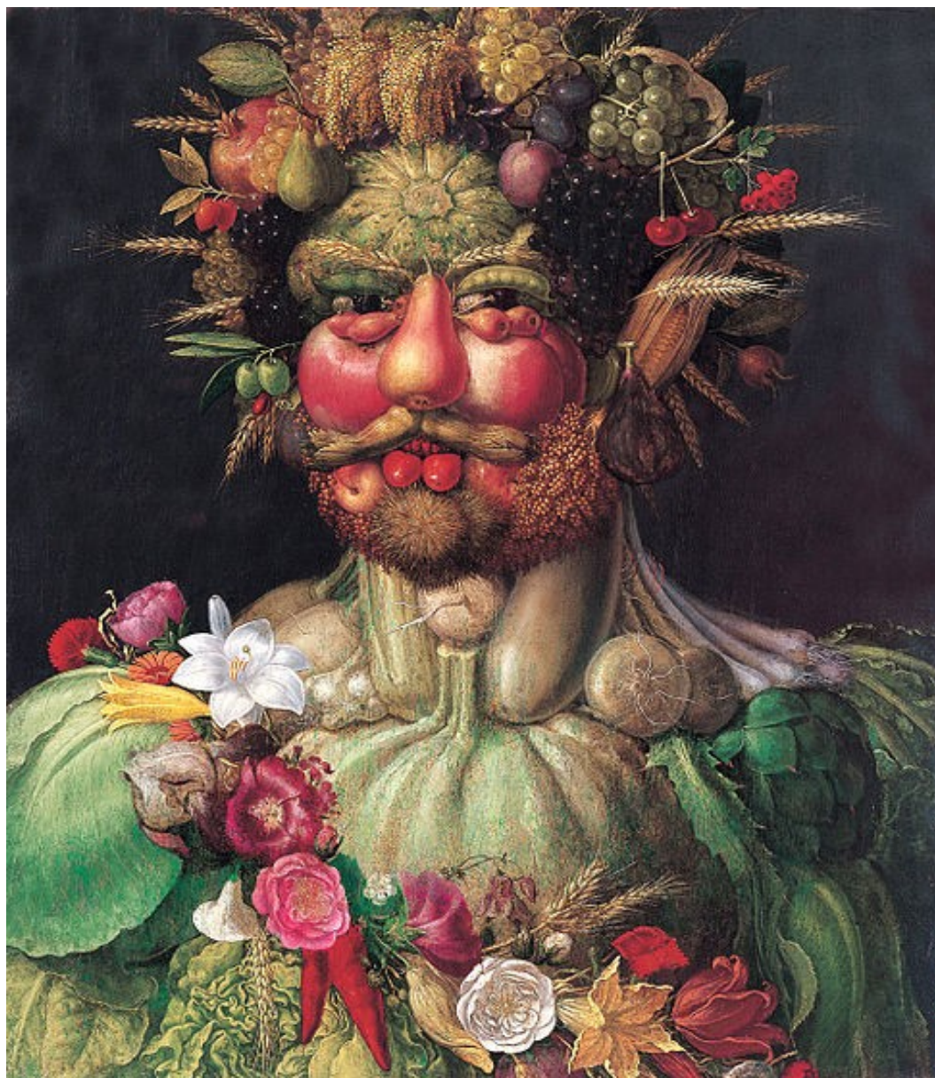
Arcimboldo: Rudolf II. jako Vertumnus (1595)