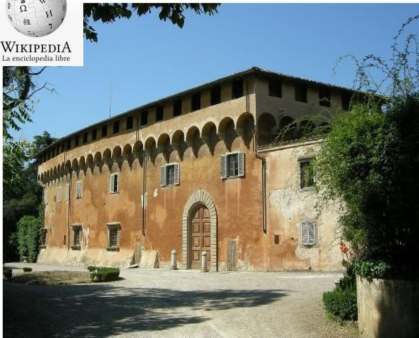
La Villa di Careggi, prima sede dell'Accademia