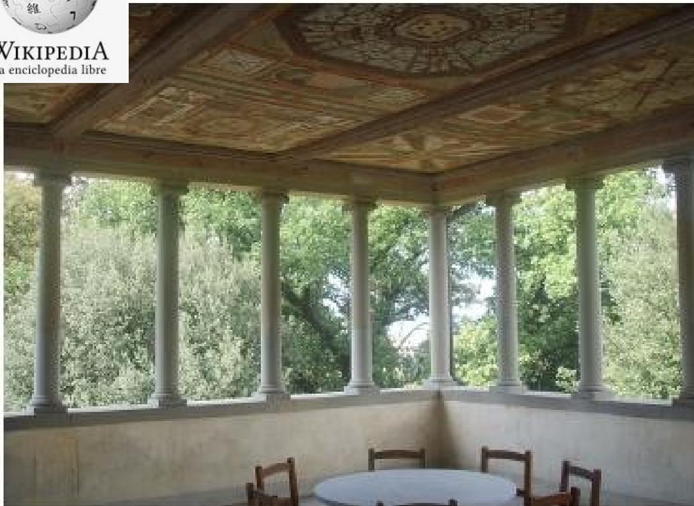
Loggia della Villa medicea di Careggi